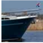
Vivante '55 Hard Top