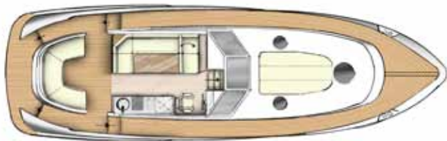
Indeling 50 CC + HT