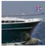
Vivante '50 Hard Top