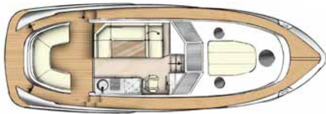
Indeling 40 CC + HT