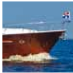
Vivante '43 Hard Top