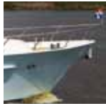
Vivante '43 Cabrio Cruiser