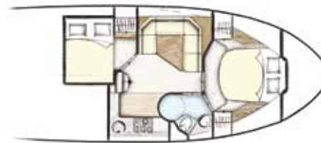
Indeling 3 43 CC + HT Staal