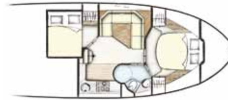
Indeling 1 43 CC + HT Staal