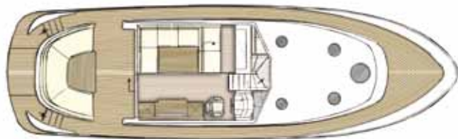
Indeling 55 CC + HT