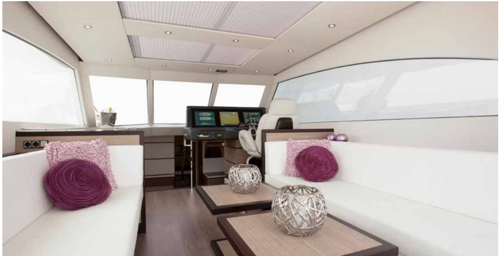
Vivante '55 Hard Top