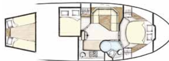
Indeling 5 43 CC + HT Staal