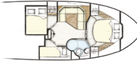
Indeling 4 43 CC + HT Staal