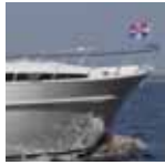
Vivante '50 Cabrio Cruiser