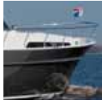
Vivante '40 Hard Top